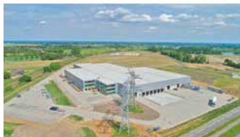
Dimass in aanbouw

Bedrijvenpark Zevenellen is op de plek waar vroeger de PLEM en de